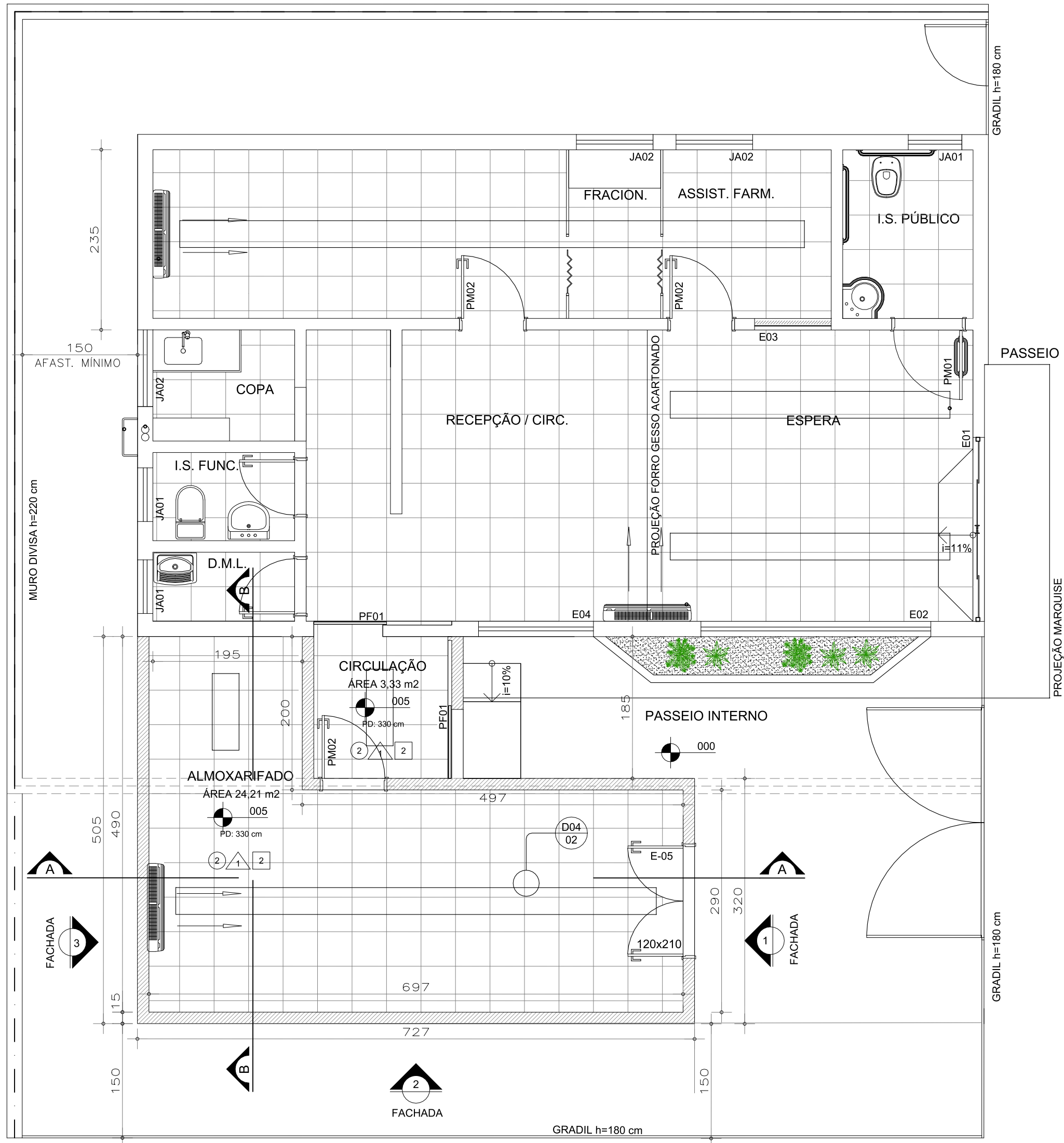
PLANTA BAIXA ESCALA: 1/50